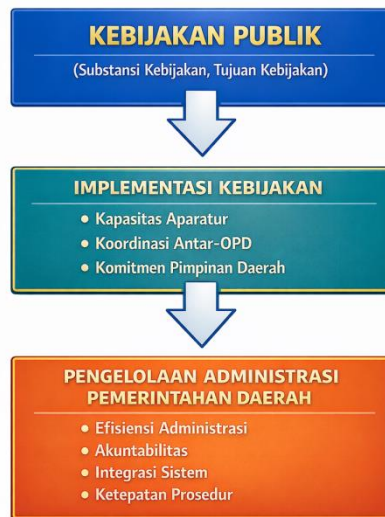
Gambar 1.1 Kerangka Konseptual Penelitian