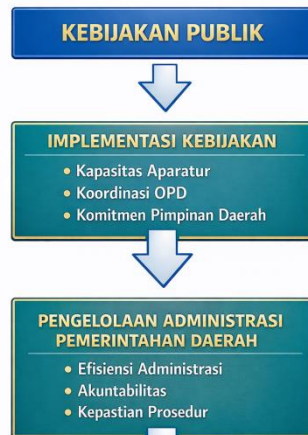
Gambar 2.1 Kerangka Pemikiran Penelitian

Kerangka pemikiran penelitian ini didasarkan pada asumsi bahwa implementasi kebijakan publik memengaruhi pengelolaan administrasi pemerintahan di daerah melalui faktor-faktor implementasi kebijakan.